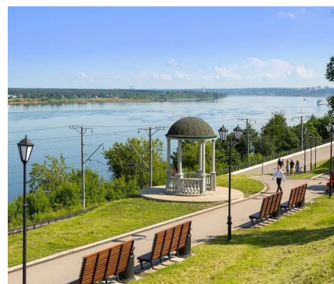
Набережная реки Кама, Пермь

Но не только название сети удивляет наших гостей и часто вызывает вопросы. АМАКС Сафар Отель в столице республики Татарстан, Казани имеет название красивое, но непривычное. Кто же такой Сафар? Ходит слух, что так звали самого первого владельца отеля, который решил не скромничать и назвать его, ни много ни мало, в свою честь. Возможно, это и так, история умалчивает, а подтверждения, как и опровержения этой теории у нас нет. Однако, название «Сафар» как нельзя лучше подходит для гостиничного комплекса: ведь слово в переводе обозначает «поездка» или «путешествие». А как корабль назовешь – так он, как известно, и поплывет – с истинным радушием принимают в Сафар Отеле путешественников, приехавших в Казань как по делам, так и познакомиться с красотой древнего города.