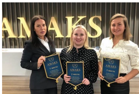
Лучшие финансово-экономические показатели среди больших отелей. Все три места занял Сибирский регион: Красноярск, Омск, Новый Уренгой

Мы поздравляем коллег с заслуженными наградами и желаем всем объектам сети новых достижений в 2020 году!