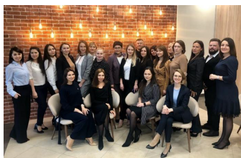
Управляющие директора объектов и сотрудники управляющей компании АМАКС в «Новой Истре», январь 2020